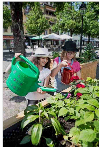
Les bacs potagers et les bancs de l'association A coup vert devaient permettre de s'approprier la rue de la Promenade. CHLOÉ LAMBERT

Farvagny, salle communale du Gibloux, jeudi 6 juin, 19 h